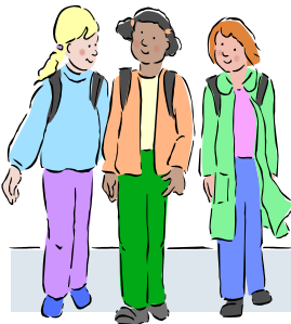
Barn- och ungdoms- habiliteringen Landstinget Gävleborg