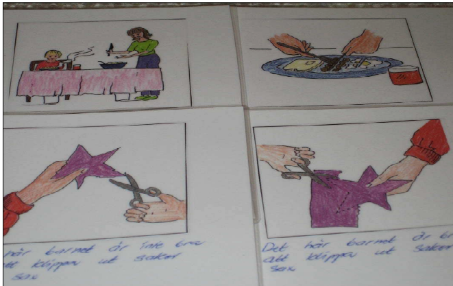
Barn- och ungdoms- habiliteringen Landstinget Gävleborg